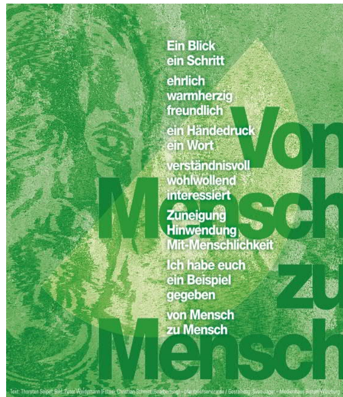
Bild: Peter Weidemann (Foto), Christian Schmitt (Bearbeitung), Thorsten Seipel (Text), Sven Jäger (Layout) - in: Pfarrbriefservice.de